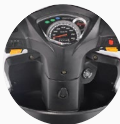
Doble guantera porta objetos.