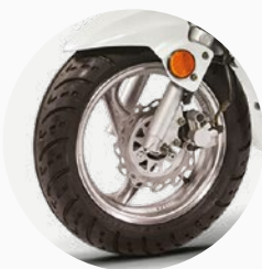
Freno delantero de disco.