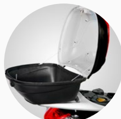
Baúl trasero portaobjetos.