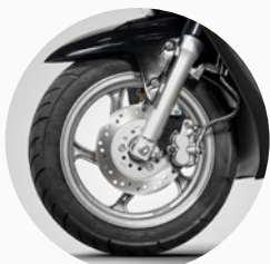
Freno delantero de disco.