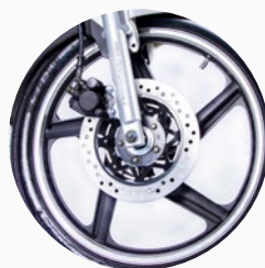
Freno delantero de disco.