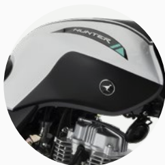
Nueva pintura combinada y gráficas.