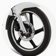
Freno delantero de disco.